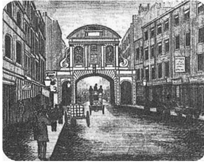
図3 ロンドン・シティの西側の入口であったテンプル・バー(1666年のロンドン大火の後に建てられ、1878年まで存続した)