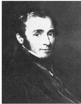
図1 ウィリアム・エンブソン